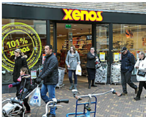
Onrust op de werkvloer bij Xenos.

De werknemers voelen zich geïntimideerd en hebben geen enkel vertrouwen meer in de directie. Bovendien is de onrust op de werkvloer de afgelopen weken flink toegenomen, nu de medewerkers vrezend voor hun baan. Verschillende werknemers zeggen tijdens een ledenbijeenkomst van FNV tegen deze krant dat ze van het ene op het andere moment een beoorde-